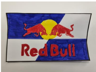
Dessin : Zan