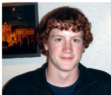
En bon descendant du néo-réalisme italien, « Le Pigeon »

Vittorio Gassman, le cinéaste réunit sous son aile les noms les plus appréciés de l'époque. A travers leurs rôles de petits malfrats (dont les frasques ne sont pas, par moments, sans rappeler celles de Laurel et Hardy), Monicelli représente en fait avec dérision toute une population d'hommes et de femmes qui s'adonnaient alors au vol à outrance. Les « habituels inconnus » ( I Soliti Ignoti ) comme le mentionne le titre original. Ces êtres marginaux qui, jour après jour, font les titres des pages des faits divers.