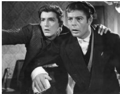
Vittorio Gassman et Marcello Mastroianni

bien qu'elle traite de mort, de misère, de maladies, tout autant que de farces et de joies, mais toujours en essayant de susciter le rire, jaune parfois.