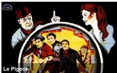
Une des affiches du film

La salle Paderewski est pleine à craquer, un public de tous les âges, parmi lequel cinq membres de la TRIBUNE des Jeunes Cinéphiles qui viennent découvrir le célèbre nonagénaire (Monicelli est né en 1915 et peut se prévaloir de 70 ans de carrière!).