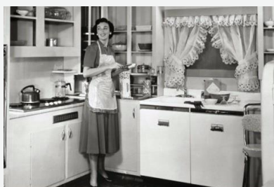
En mai 2011, un article de fr.myeurop.info

dénonçait une forte tendance parmi les Autrichiennes (1 sur 2) à souhaiter être femme au foyer, dans la tradition KKK (Kinder – Küche – Kirche) !